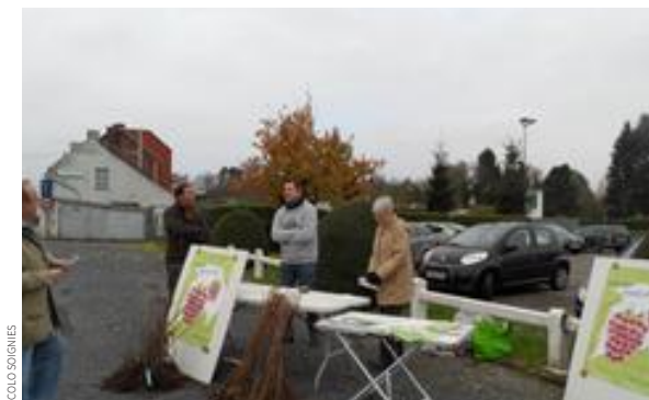
Action petits fruitiers : Par ce geste symbolique, Ecolo veut rappeler qu'il est plus que jamais nécessaire de soutenir la production locale et de qualité.