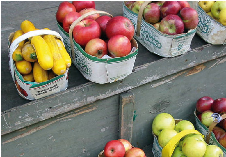
Les circuits courts